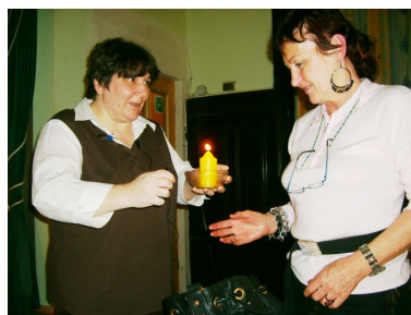
Das Element Feuer wird aufgestellt.

Wenn es aber unser inneres Feuer ist, das uns den Weg weist, ist es möglich, genau das zu finden, was uns ganz persönlich immer wieder neu die besten Wachstumschancen und Entfaltungsmöglichkeiten bietet.