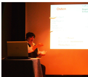
Federn als Symbol für das Element Luft.

aber eigentlich, um genau wahrzunehmen, in welcher Situation wir uns gerade befinden. Dazu müssen wir Sinneseindrücke empfangen und auf die richtigen Ideen lauschen, die uns helfen, in jeder Situation genau so zu reagieren, wie es der Augenblick erfordert. Die riesige Menge an Sinneseindrücken, die uns in jedem Moment erreicht, filtern wir gerne mit Hilfe unserer Glaubenssysteme und Philosophien.